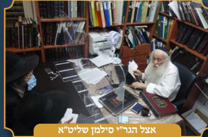
אצל הגר"י סילמן שליט"א