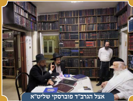
אצל הגר"ד פוברסקי שליט"א