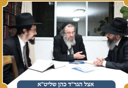
אצל הגר"ד כהן שליט"א

מתוך דבריהם של מרנן ורבנן גדולי ישראל: התוכנית של הגמ"ח מפליאה ומדוקדקת מאד הן מהצד ההלכתי והן מהצד הכלכלי