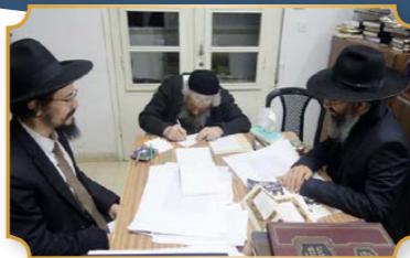
מרן ראש ישיבת סלבודקה הגר"ד לנדו שליט"א על ההצטרפות לגמ"ח "אושר בכבוד": "ואשרי כל העושים והמעשים בעניין נכבד מאד ונצרך מאד זה"