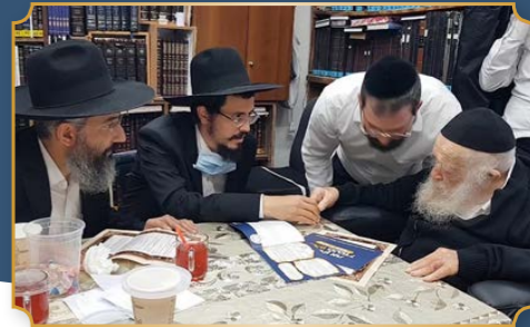
ראשי הגמ"ח קיבלו את ברכתו של מרן שר התורה הגר"ח קנייבסקי זצוק"ל, שהתפעל מהתוכנית הייחודית. הגר"ח האזין לכל הפרטים ברוב קשב וביקר את ראשי הגמ"ח בחום ובמאור פנים בברכת ברכה והצלחה.