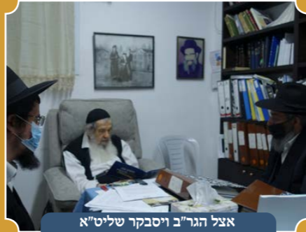
אצל הגר"ב ויסבקר שליט"א