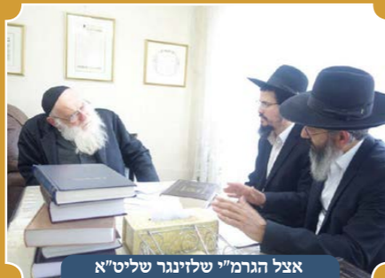
אצל הגר"י שלינגר שליט"א