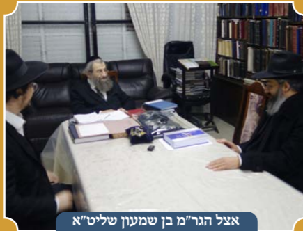
אצל הגר"מ בן שמעון שליט"א