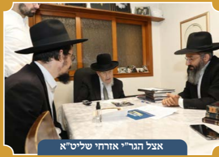
אצל הגר"י אזרחי שליט"א

בהוראות גדולי הפוסקים שליט"א היות וכספי ההפקדה משמשים להלוואות ואינם מוכנים להשקעות, ניתן להפקיד לכתחילה מכספי מעשרות, כאשר לפי המתווה ההלכתי של הגמ"ח אתם זוכים לקיים מצוות הלוואה בכל הלוואה.