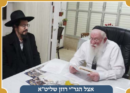
אצל הגר"י רוזן שליט"א