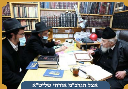
אצל הגר"מ אזרחי שליט"א

מתוך דבריהם של מרנן ורבנן גדולי ישראל: התוכנית של הגמ"ח מפליאה ומדוקדקת מאד הן מהצד ההלכתי והן מהצד הכלכלי