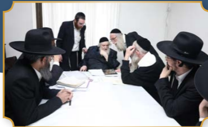
זקן הפוסקים ראב"ד העדה החרדית הגר"מ שטרנבוך שליט"א: "הנני מצטרף..בברכה לכל המצטרפים בארגון אושר בכבוד וזהירם מאיסור ריבית החמורה... שיעליחו בכל מעשה ידיהם ויזכו להקים בתים נאמנים בישראל..."